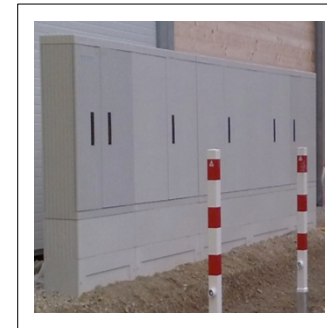
SWM-Übergabe Eishalle Moosburg